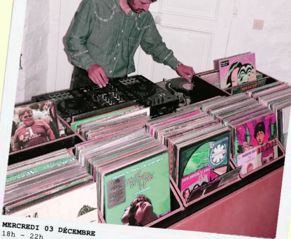
MERCREDI 03 DÉCEMBRE 18h - 22h Opening du marché des créateurs dans la serre *Foodtruck + Bar à cocktails et vins + DJ GOODWAVES Entrée gratuite - Ouvert à tous et du jeudi 04 au samedi 06 décembre de 11h à 19h