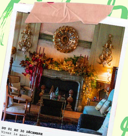
DU 01 AU 30 DÉCEMBRE Vivez la magie de Noël avec les décorations dans tout le domaine et salons privés