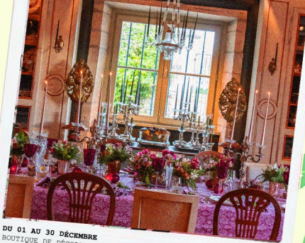
DU 01 AU 30 DÉCEMBRE BOUTIQUE DE DÉCORATION, FLEURISTE ET CHRISTMAS SHOP (ARTS DE LA TABLE, DÉCORATION, ÉPICERIE FINE, ACCESSOIRES, DÉCORATION, CADEAUX DE NOËL, COFFRETS...) Du mercredi au samedi et les dimanches 14 et 21 décembre 12h30 à 20h