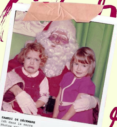
SAMEDI 06 DÉCEMBRE 16h dans la serre Photos avec le Papa-Noël Coffee Shop by DEZAMY