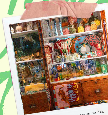
TOUT DÉCEMBRE Privatisez nos salons pour vos repas en famille, entre amis ou d'entreprises ... SALLE À MANGER : 8 à 16 personnes GRAND SALON : 18 à 26 personnes PERGOLA : 30 à 60 personnes