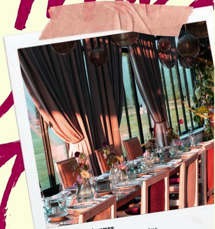
DU 17 AU 30 DÉCEMBRE Restaurant du domaine de Gastelur Ouvert midi et soirs MENU DES FÊTES 55€ euros le midi 75€ euros le soir